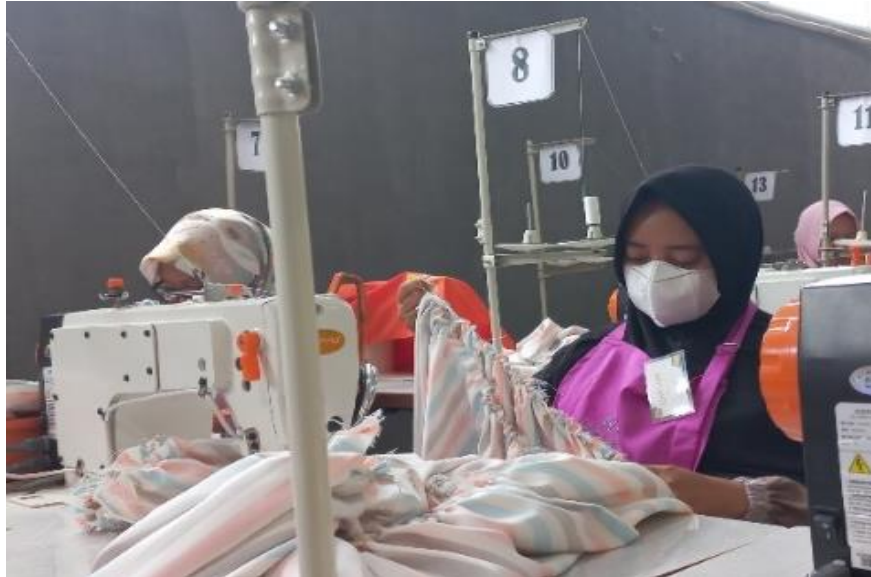
Gambar 3. praktik menjahit menggunakan mesin jahit high speed

langsung adalah bagian dari belajar dari pengalaman. Para peserta pelatihan di Tata Busana SKB Ungaran dapat mengalami langsung bagaimana mengoperasikan mesin jahit dan membuat pola di kain.