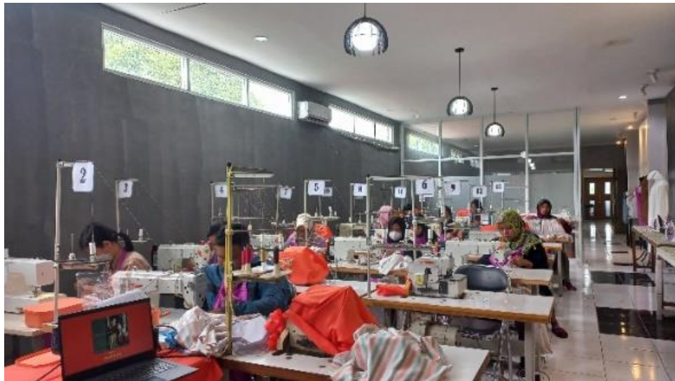
Gambar 1. Suasana belajar dan penataan ruang

Diagnosis kebutuhan belajar, cara lembaga SKB Ungaran untuk mendiagnosis kebutuhan belajar adalah dengan melibatkan para instruktur dalam pembuatan model pembelajaran. Peran instruktur tidak hanya mengajar di kelas saat pembelajaran tetapi juga mesti bisa mempertimbangkan prinsip-prinsip pembelajaran orang dewasa ketika merancang kurikulum yang berfokus pada kebutuhan pembelajar dewasa (Caruth, 2014: 26). Mereka mendapatkannya dari evaluasi-evaluasi dari tiap pelatihan yang pernah dilakukan. Model pembelajaran tersebut kemudian langsung dipraktekkan saat pelatihan berikutnya berlangsung. Para instruktur kemudian melakukan asesmen kepada para peserta sejauh mana kompetensi mereka dalam bidang Tata Busana. Hal itu menjadi bahan untuk memenuhi kebutuhan para peserta pelatihan. Instruktur juga terus melibatkan para peserta dalam proses pembelajaran, memberi kesempatan mereka untuk mempelajari apa yang belum dipahaminya.