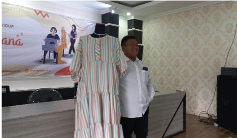
Gambar 2. Karya salah satu peserta pelatihan menjahit

Praktik pendidikan tradisional melakukan evaluasi belajar dengan cara guru memberi nilai kepada muridnya. Hal ini tidak bisa diterapkan dalam pendidikan orang dewasa karena cara tersebut kekanak-kanakkan. Teori andragogi menyebut proses evaluasi belajar dilakukan dengan cara guru mencurahkan energi untuk membantu orang dewasa untuk mendapatkan bukti tentang kemajuan yang telah mereka tempuh dan bagaimana kesesuaiannya dengan tujuan pendidikan yang mereka inginkan (Knowles, 1977: 50). Instruktur juga perlu meninjau kekuatan dan kelemahan dari program pendidikan yang dijalankan. Evaluasi dalam hal ini merupakan usaha bersama antara instruktur dan peserta pelatihan.